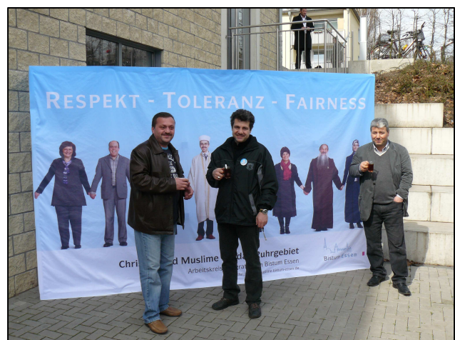
die Plakatwand beim Kulturfest „Marxloh stellt sich quer“ an der Merkez-Moschee in Duisburg-Marxloh am 28.03.2010