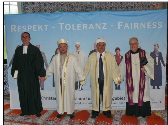
Die Plakatwand in der Fatih-Moschee in Essen-Katernberg beim Friedensgebet der Religionen anlässlich der „Mahnwache“ von ProNRW am 26.03.2010